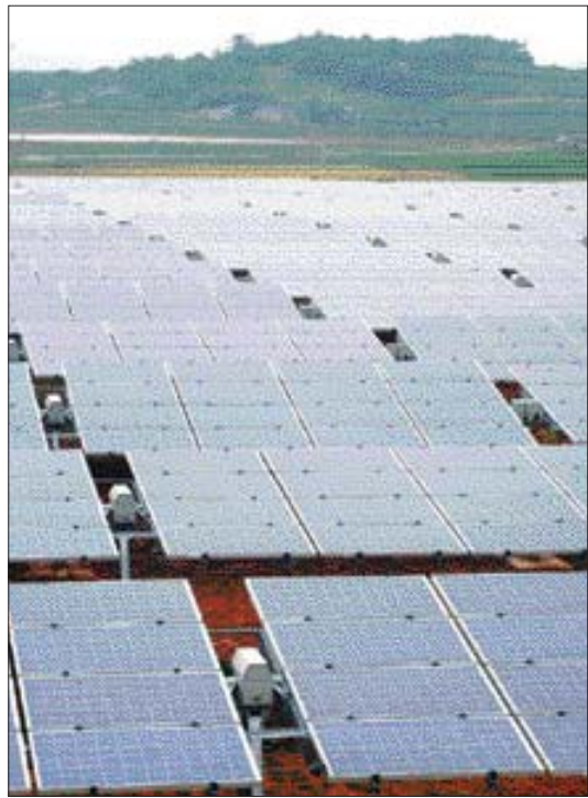
양광 도시) 조성을 추진하고 있다.