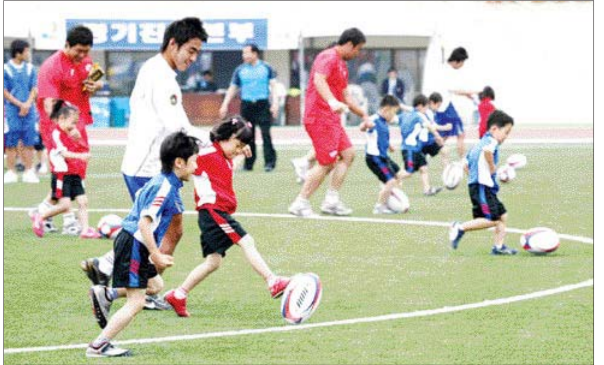
"럭비공아 같이 놀자"

11일 강진지역 유치원생 110여명이 종합운동장에서 제 19회 대통령기 전국 럭비 선수권대회에 참가한 선수들과 함께 드ри블 체험행사를 갖고 있다. 지난 10일 개막한 전국 럭비 선수권대회는 오는 19일까지 일반부와 대학부, 고등부, 중등부 등 4개 종목이 열리며, 24개팀에서 선수와 임원 1천여명이 참가했다.