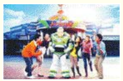
버즈 라이트이여 에스트로 블라스터