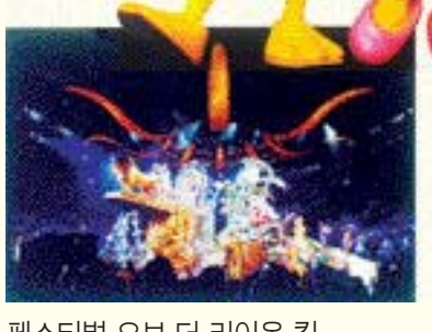
페스티벌 오브 더 라이온 킹