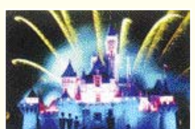
디즈니 인 더 스타