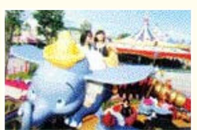
날오는 코끼리 탐보