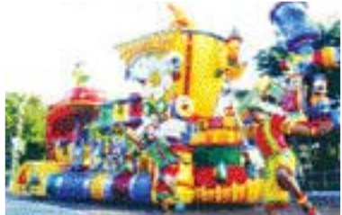
디즈니 온 퍼레이드

쇼핑과 관광, 세계적인 음식들을 맛볼 수 있는 홍콩. 홍콩은 최근 디즈니랜드 개장으로 또 하나의 명소를 갖게 됐다. 홍콩 디즈니랜드는 기상천외한 상상의 세계를 우리 눈앞에 현실로 느끼게 한다. 멋진 동화속 세계와 시간을 넘나드는 공간이 눈앞에 생생하게 펼쳐진다. 동화속 궁전에서 은하계, 머나먼 정글의 코끼리 까지 만나 볼 수 있다. 스물스물 뺨이 거어 나오는 가 하면 어느새 수다스러운 곰이 등장한다. 아름다운 공주들과 함께 사진을 찍거나 우주 시대의 로켓에 탑승해 보는 다양한 즐거움을 하루 만에 만끽할 수 있다. 티켓 한 장이면 세계 최고 수준의 멋진 공연과 다양한 게임과 놀이기구를 즐길 수 있다. 친구들과 가족, 연인들의 소중한 추억을 만들고 싶다면 디즈니랜드를 방문해 보자. 디즈니랜드 입구에 들어서면 미키마우스가 고래에서 뿜어져 나오는 분수