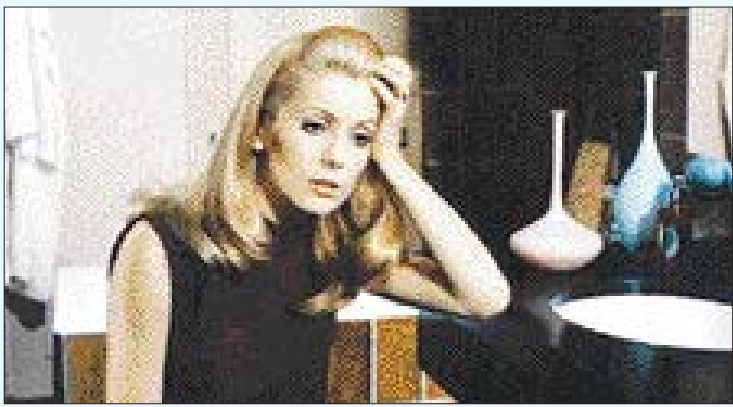
카트린느 드뇌브의 도발적인 아름다움을 만끽할 수 있는 '세브리네'

프랑스 여배우 카트린느 드뇌브의 젊은 시절을 만날 수 있다. 영화계의 거장 프랑수와 트뤼포와 장뤽 고다르의 영화화 한자리에서 감상할 수 있다. 베니스·베를린·칸 등 세계 3대 영화제 수상작들 역시 관객들을 기다리고 있다. 전문가·관객들 '씨네 토크'도 준비 주한프랑스문화원이 주최하는 '씨네 프랑스-거장에서 신예 감독까지 15편의 프랑스 영화의 만남'이 오는 14~26일까지 광주극장에서 열린다. 장뤽 고다르의 작품으로는 사람의 순간을 만남, 열정, 이별, 화해로 묘사한 '사랑의 찬가'와 지옥, 연옥, 천국 등 단계 작 '신곡'의 구성을 다