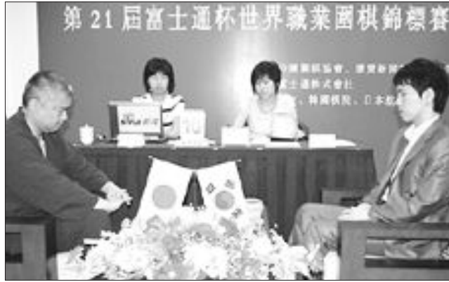
이창호 9단(오른쪽)이 지난 7월 베이징 중국기원에서 열린 제21회 후지쓰배 세계바둑선수권대회 8강전에서 일본의 요다 노리모토 9단에게 승리하는 모습.

또 이창호는 후지쓰배에서도 8강에 진출한 한국 선수 4명 중 유일하게 4강에 올랐다. 이창호 9단은 지난 7월 중국 베이징 중국기원에서 벌어진 대회 8강에서 일본의 요다 노리모토 9단을 이겨 준결승 티켓을 따냈다. 이로써 이창호는 춘란배·잉씨배(이상 8강), 후지쓰배(4강)에서 우승을 노리게 됐다. 이들 4대 메이저급 국제 개인전서 모두 살아있는 기사는 세계에서 이창호 뿐이다. 응씨배는 한국의 우승이 점쳐진다. 이창호를 비롯해 이세돌 9단과 최철한 9단도 올라 있기 때문이다. 나머지 한 자리를 쟁한 중국의 류싱 7단만 남으면 응씨배는 한국 기사의 몫이 된다. 문제는 춘란배와 후지쓰배이다. 유일하게 우승을 노리고 있는 이창호가 이 두 대회에서 우승을 거둔다면 한국은 모든 세계 기전의 타이틀을 보유하게 되는 것이다. 전망은 밝다. 이창호는 구리 9단이 타이틀을 차지하기 전에는 두 차례나 이창호가 춘란배 우승을 차지한 경험이 있어 최근의 상승세를 이어 간다면 우승도 노려볼만 하다. 또 이창호가 오는 7월 5일 류싱 7단과 준결승전을 벌이는 후지쓰배는 한국이 10연패를 기록할 만큼 한국과의 인연이 깊은 대회