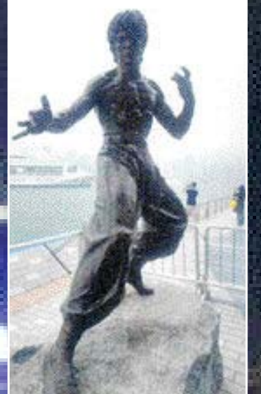
영화의 거리 이소룡상