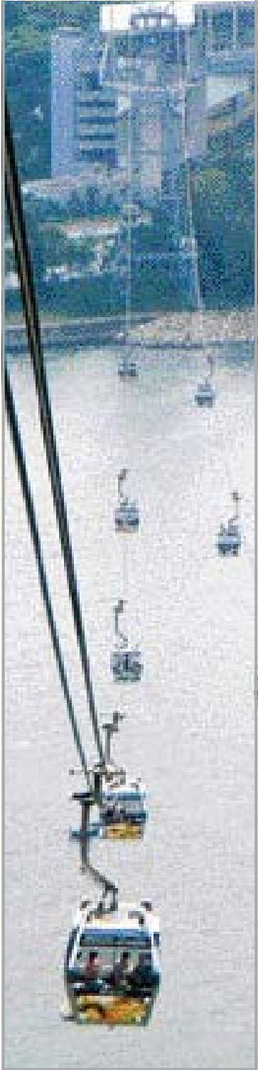
란타우 섬을 가기 위해서는 '올림픽 360 스카이 레일'을 이용해야 한다. 란타우섬의 통충에서 올림픽빌리지까지는 25분이 소요되는 5.7km의 케이블카.

홍콩은 쇼핑과 세계적인 음식을 맛볼 수 있는 별미의 천국이지만 볼 거리들도 많다. 세계적인 관광도시인 만큼 지도한 장 달랑 들고 발품을 팔면 얼마든지 홍콩의 재미를 만끽할 수 있다. 크게 란타우섬과 홍콩섬, 원차이와 코즈웨이 베이, 구룡반도로 나눠 관광을 가는 것이 좋다.