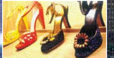
아울렛 매장에 진열된 구두