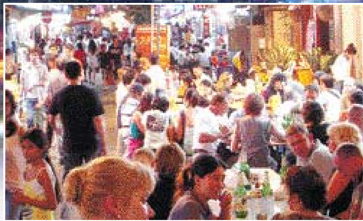
밤에도 볼아성을 이루는 '레이디스 마켓'의 야외식당

높은 산과 빌딩 숲, 바다가 어우러져 인상적 광경을 연출하는 홍콩섬은 홍콩의 과거와 현재가 교차하고 있다. 국제적 기업들의 이름들만 높은 건물들 사이로 전통 가구를 파는 거리와 재래시장, 널찍한 공원이 숨어있다. 센트럴&에드미럴티는 홍콩에서 가장 높은 건물인 IFC 건물 등이 몰려