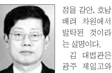
김황식(60)대법관 내정.

지난달 13일 사퇴한 전윤철 전 감사원장 후임에 김황식(60)대법관에 내정된 것으로 전해졌다. 청와대는 김 대법관에게도 감사원장 내정 사실을 이미 통보한 것으로 알려졌다. 김 대법관이 감사원장에 내정된 것은 장성 출신이라는 점이 크게 작용한 것으로 보인다. 현재 사정기관 수장이 모두 영남 출신이어서 '호남 배재론'이 거셌던