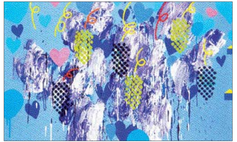
'즐거운 풍경 8046'

미술평론가 장석원씨는 "이들 사물들은 매우 흔하지만, 그 속에는 견디기 힘든 고통과 기쁨이 담겨있다. 김씨의 작품은 어려운 과정을 견뎌낸 기쁨의