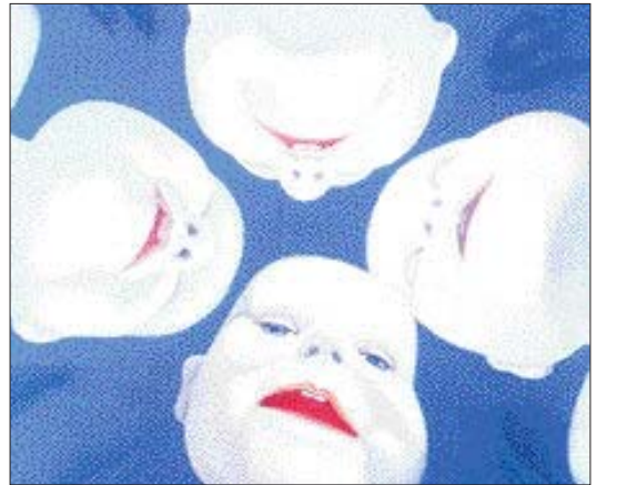
최재영 작 'Discussion'

계백화점 본점에서 열린다. 그동안 소장품 전과 작가의 작품을 작가 단위로 모아 아트페어를 열었지만 올해부터는 화랑의 참여를 받아 본격적인 아트페어 형태를 갖는다. 10여 개의 국내 화랑이 참여한다.