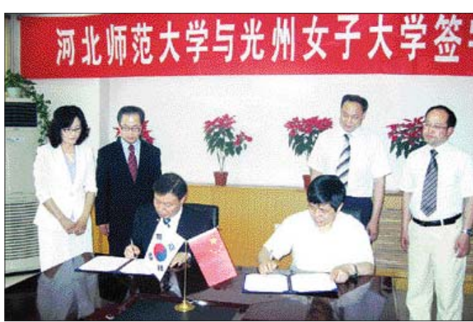
광주여자대학교(총장 오정원)는 최근 중국 북경과 상해에서 하북사범대학교, 상해공상외국어직업대학교와 교류협정을 맺었다.