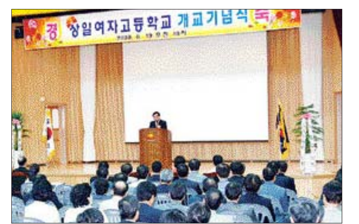
광주 서구지역 유일의 여자고등학교로 지난 3월 개교한 상일여고가 19일 교내 강당에서 개교 기념식을 가졌다.