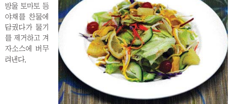
겨자 소스 샐러드=양상추, 방울 토마토 등 야채를 찬물에 담갔다가 물기를 제거하고 겨자소스에 버무려낸다.