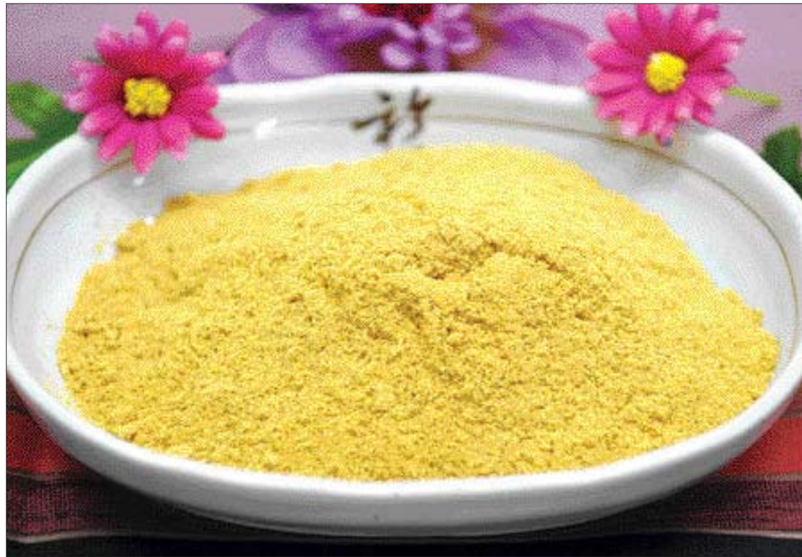
겨자에는 소화를 돕는 '시니그린' 성분이 많이 함유돼 있다.

겨자는 몸을 따뜻하게 하는 성분이기에 몸이 찬 사람의 경우 냉증 해소에 크게 도움이 된다. 겨자는 혈액순환을 좋게 하고, 살균·소독 효과도 있다. 또 내장의 염증을 없애주고 심한 설사를 멎게 한다. 시중에서 쉽게 구할 수 있는 겨자 가루 200g 가량을 헝겊에 한 다음 물에 넣으면 된다. 겨자를 우려낸 물에 발을 담그는