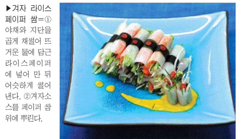
겨자 리스페이퍼 썸=①야채와 지단을 곱게 채썰어 뜨거운 물에 담근 리스페이퍼에 넣어 만 뒤 어슷하게 썰어낸다. ②겨자소스를 페이퍼 썸 위에 뿌린다.