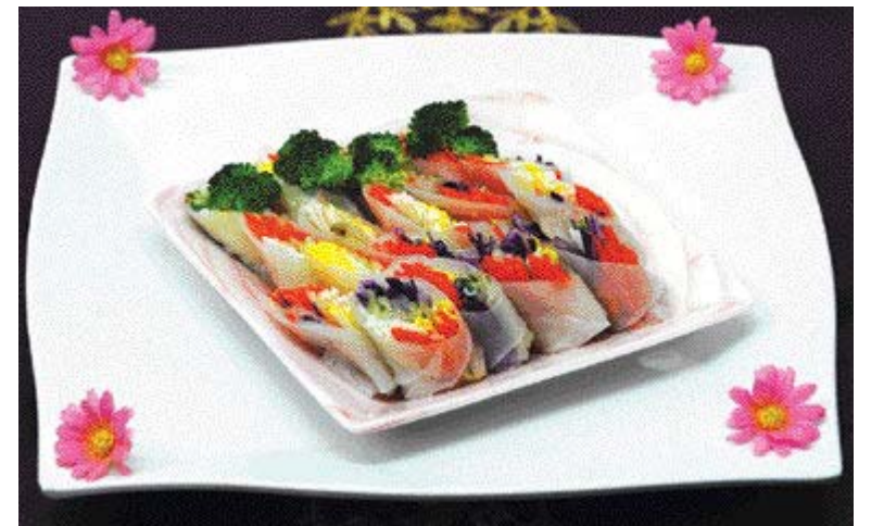
겨자 소스와 삼색 잡채=①오이, 당근, 도라지를 곱게 채썬다. 무를 초절임한다. ②준비한 야채를 넣고 푹푹 삶고 다시마로 띠를 만들어 두른다. ③겨자소스(겨자가루, 설탕 1큰술, 식초 1큰술, 소금 약간)에 찍어서 먹는다.

겨자 팅은 몸의 표면에 발적(發赤)을 일으켜서 내부의 울혈(鬱血)이 흘러내리게 해준다. 폐렴, 기침, 감기, 요통, 좌골신경통, 관절염, 디스크, 신