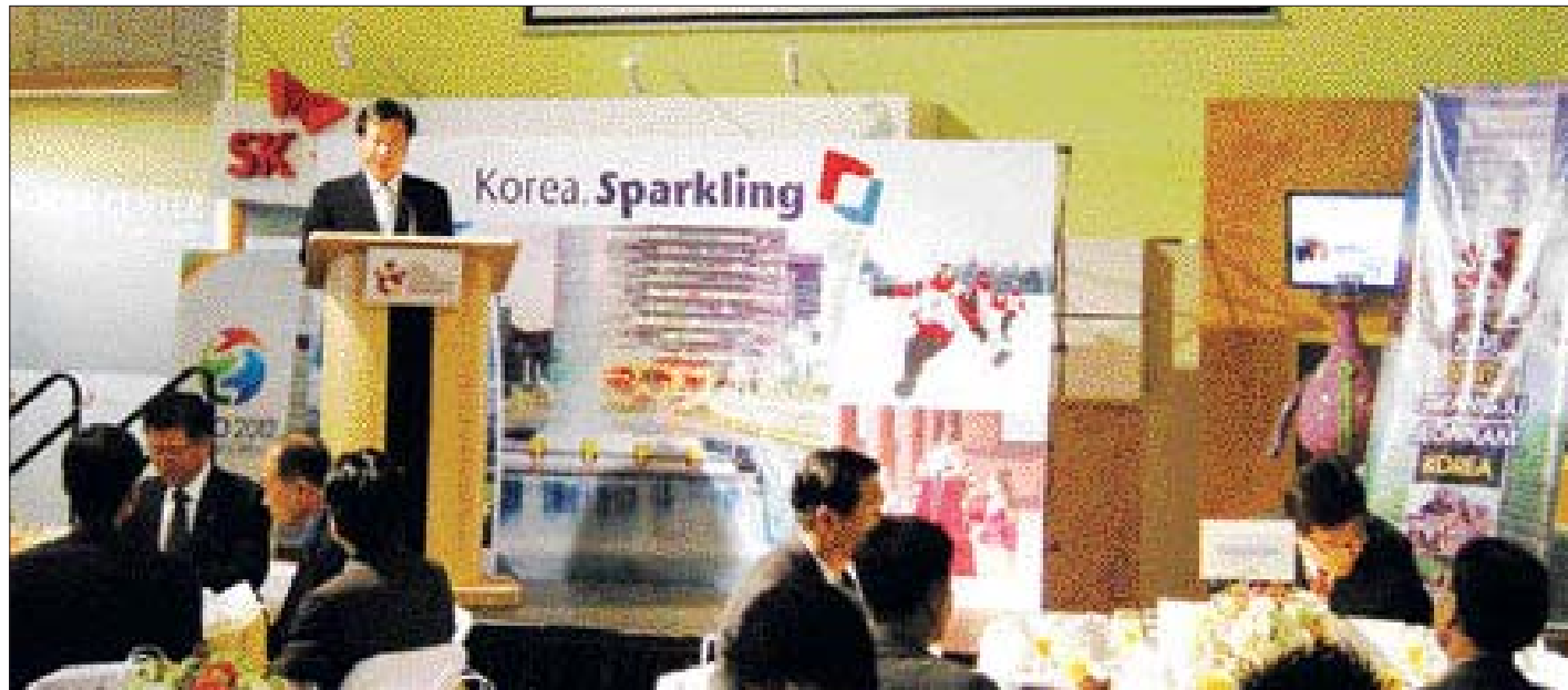
광주시 관계자들이 최근 미국 로스앤젤레스 코리아센터에서 미국 여행사 관계자들이 참석한 가운데 광주·전남 관광상품 설명회를 갖고 있다.

'2008광주·전남 방문의 해'를 맞아 1천여 명이 달하는 해외 관광객들이 광주·전남 방문을 예약해 외국인 관광객 유치사업이 탄력을 받을 전망이다.