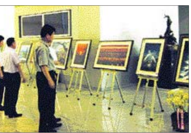
‘광주시청 사진동호회 회원전’이 23일 시청 1층 시민 홀에서 개막했다. 오는 27일까지 열리는 이번 전시에는 광주시청 공무원 26명이 영어에 담은 50여점의 작품이 선보인다.