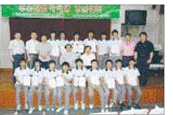
광주공업고등학교(교장 주규봉)는 5월30일~6월23일 ‘제2회 전문 고교생 및 중학생 우수창업 아이템 경진대회’를 개최했다.