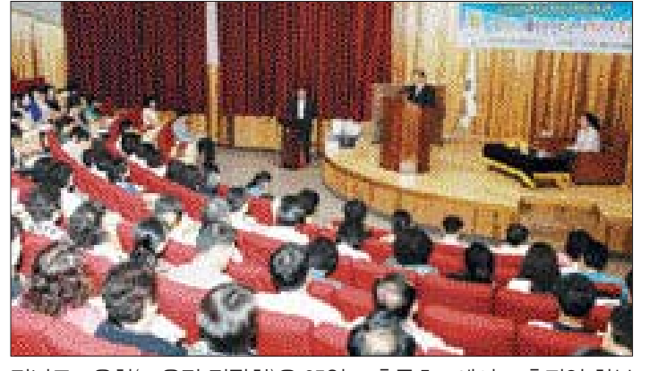
전남도교육청(교육감 김장환)은 25일 고흥초등학교에서 고흥지역 학부모 200명을 대상으로 정보통신 윤리교육을 실시했다.