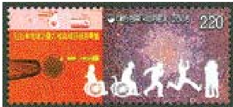
〈즐거이배양 성공 기념 발행〉