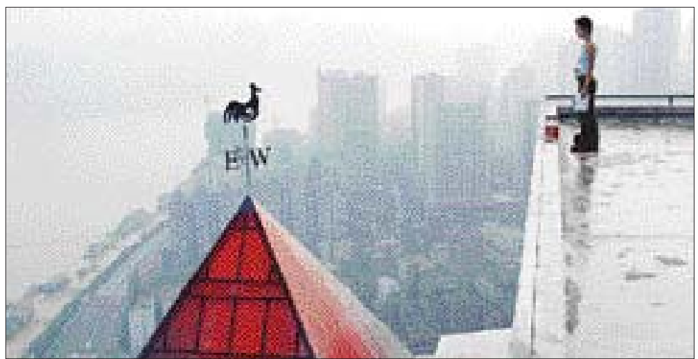
'호기심이 고양이'는 서양 속담은 지나친 호기심이 위험을 초래한다는 뜻을 담고 있다. 사진은 영화 '호기심이 고양이'를 죽인다'의 한 장면.