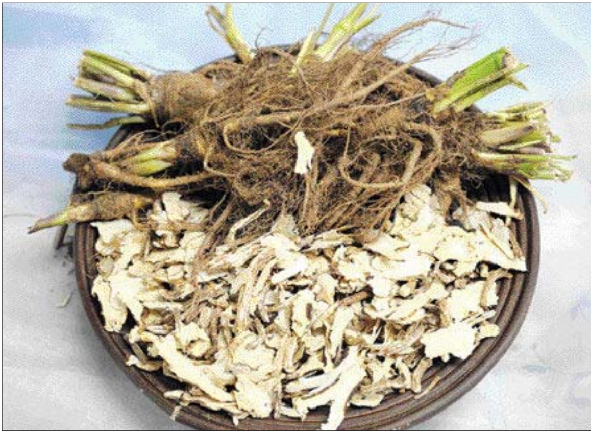
당귀에는 혈액 순환을 돕는 다양한 비타민과 유기성분이 함유되어 있다.

우리가 흔히 말하는 당귀는 참당귀를 말하며 생약은 그 뿌리를 말린 것이다. 참당귀는 1~2m까지 자라며 일반적으로 자줏빛이 돌고 꽃도 자주색을 띤다. 참당귀는 경남북, 강원, 경기지역의 산속 습윤한 계곡에