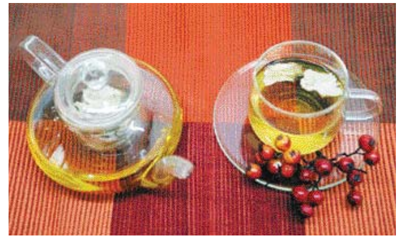
▶ 당귀 약차=당귀와 생강, 대추를 약한 불에서 은근하게 우려 풀이나 시럽으로 당도를 맞춘다.

▶ 마늘 양송이 장조림 =당귀 우린물과 간장, 황설탕을 넣어 끓이다가 마늘, 양송이를 넣고 조리한다.