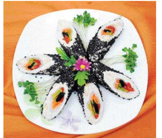
<도움말=김지현 요리학원 한도연 강사·푸드스타일리스트 정강영>

▶ 닭가슴살 수삼말이 =①닭가슴살을 넓게 펼쳐서 소금, 후춧가루, 당귀가루로 밑간해서 20분간 냉장고에 보관한다. ②홍고추, 당근, 풋고추, 수삼, 김을 넣고 돌돌 말아 랍으로 싸서 김오른 찜기에 15분 찜는다. ③흰자를 걸면에 발라 겉면에 골려 한 입 크기로 썬다.