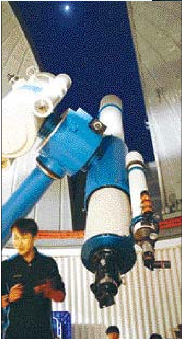
여주청소년수련원 내 세종천문대에서 학생들이 26인치 굴곡천체망원경을 통해 별을 관측하는 방법을 설명 듣고 있다