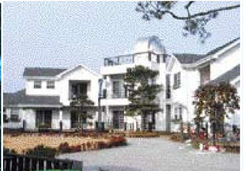
안면도 스타 팰리스