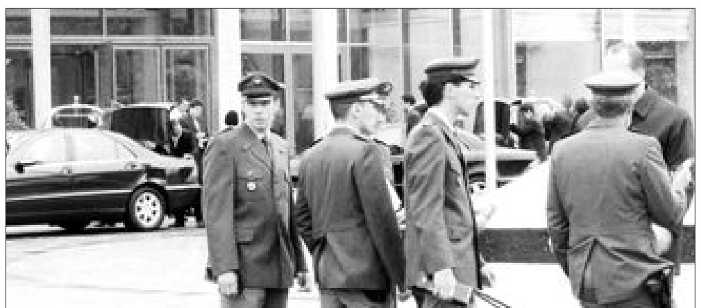
지난 2005년 5월 5일 열린 빌더버그 회의 개최 첫날 모습. 독일 경찰이 회의장 주변을 감시하고 있다.

〈랜덤하우스코리아·1만5천원〉 /이이미기자 emlee@kwangju.co.kr