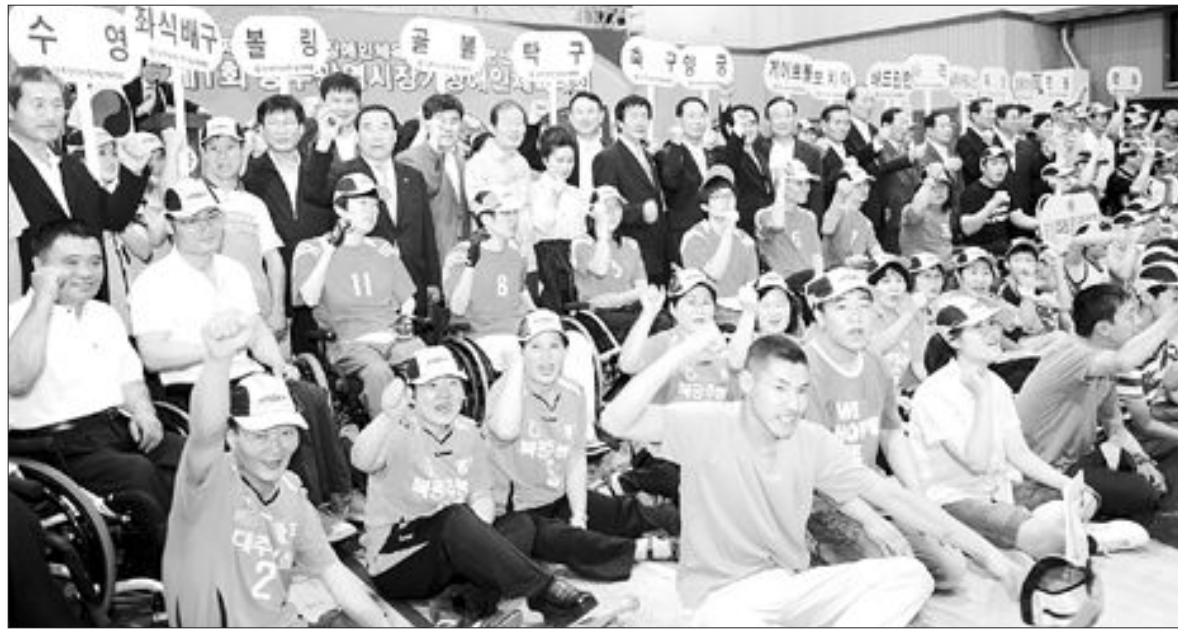
장애인 선수들 “필승” 8일 광주시 북구 시립장애인복지관에서 열린 '제1회 광주시장애인체육대회' 개최식에서 참가 선수들이 필승을 다짐하고 있다. 오는 13일까지 계속되는 이번 대회에는 16개 종목에 400여명의 선수들이 참가해 그동안 뛰어난 기량을 겨룬다.