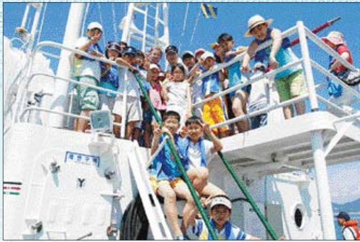
(사)섬문화연구소가 지난 6월 말 원도군 일대에서 문학캠프를 진행한 가운데 참가자들이 경비정에 올라 포즈를 취하고 있다.

▲ 2008 섬진강여름문학학교 =광주·전남작가회의(회장 박해강)가 오는 26일부터 1박2일간 곡성