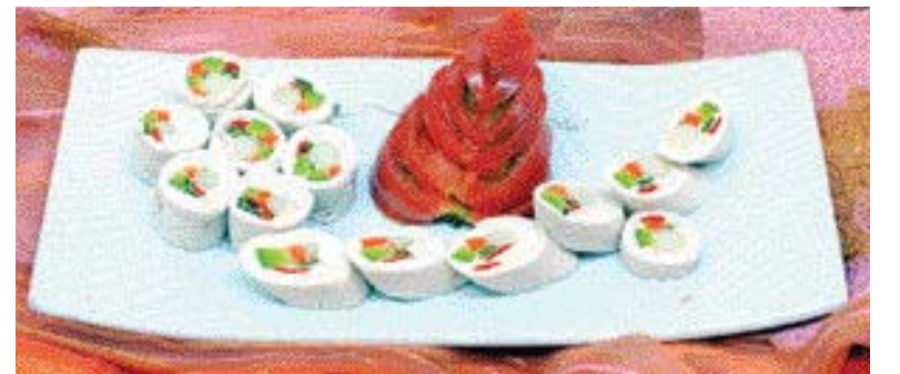
▲닭가슴살 전복말이=①닭가슴살을 넓게 펼쳐 소금, 후추로 밑간한다. ②수삼, 전복, 당근, 애호박 등을 팬에 볶아 소금 간하고 닭가슴살에 넣고 말아 찜기에 20분 정도 찜는다. ③식힌 다음 한 입 크기로 썰어 낸다.

▶전복 무 썬말이=①무를 얇게 잘라서 식초, 설탕, 소금, 물을 희석한 소스에 1시간 정도 절인다. ②절인 무위에 파프리카, 무순, 전복, 홍고추를 올려 싸준 다음 데친 미나리로 묶는다. ③먹기 직전에 ①의 소스를 뿌린다.