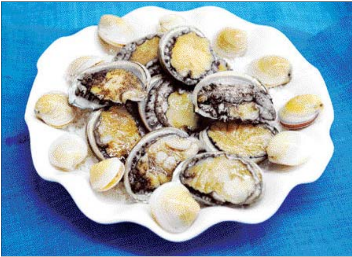
전복에는 시력 회복과 간장 해독 작용을 하는 타우린 성분이 많이 들어 있다.

요오드는 주로 해산물 속에 존재하는데 지방을 태워서 에너지를 생성시키는 효능이 있는 것으로 알려져 있다. 우리 몸에 요오드 성분이 부족하면, 살이 찌거나 혈관 내에 지방이 쌓일 수 있다. 또 갑상선 기능 저하되고 피부가 거칠어질 수 있다. 환절기, 이유없이 피부가 거칠어지면 요오드 성분이 풍부하게 함유돼 있