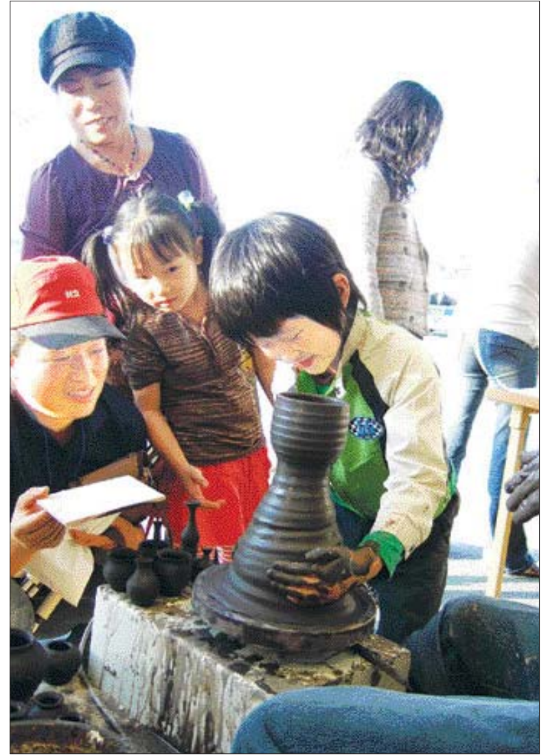
지난 12일 전남도 지정 한옥민박마을인 해남군 삼산면 소재 무선동을 방문한 대전지역 초등학생들이 도자기 빚기 체험 행사에 참여하고 있다. 전통 한옥 20여채가 웅기종기 모여있는 무선동은 전통소리체험을 비롯해 다도와 도자기 체험 등 각종 전통문화 프로그램을 운영하고 있다.