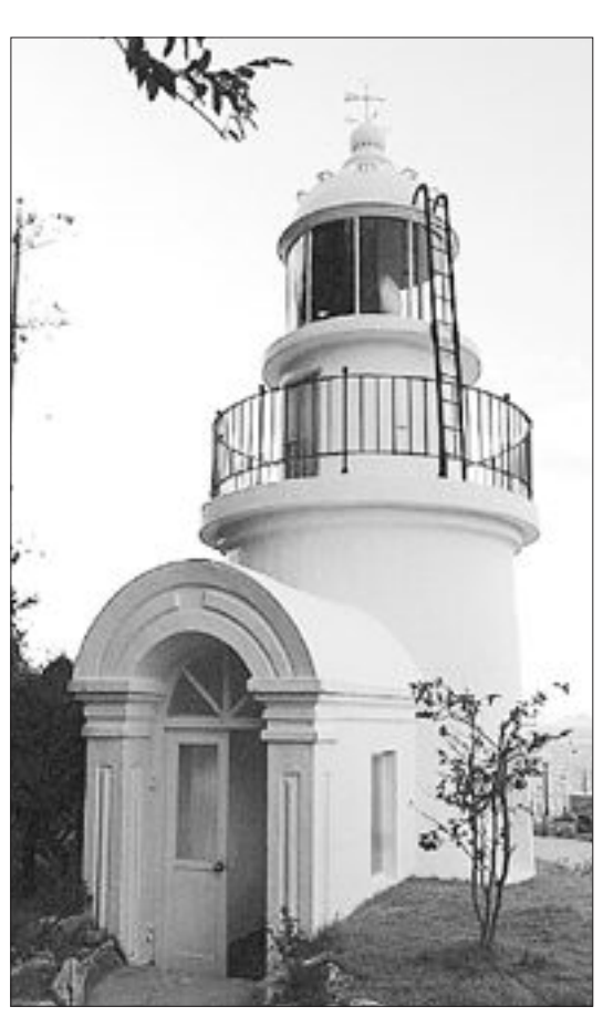
<옛 목포구 등대>

다는 입장을 밝힌 바 있다. 하지만 전남은 초광역권 사업인 '남해안 선벨트 사업'은 전남의 도서 개발을 앞당길 수 있을 것으로 기대된다. 선벨트 사업은 목포와 순천·여수·광양을 거쳐 하동·남해·사천·부산을 잇는 남해안 벨트를 수도권에 필적하는 초광역 경제권으로 육성하는 전략이다. 이전철 전남발전연구원 기획경영실장은 "광역경제권 사업 호남권의 경우 광주·전남과 같은 경제권을 공유하고 있지 않은 전북이 포함돼 나머지 효과를 거둘 수 있을 지 의문스럽다"며 "지역별로 사업효과를 극대화할 수 있는 보완책이 뒤따라야 한다"고 말했다. /윤영기기자 penfoot@