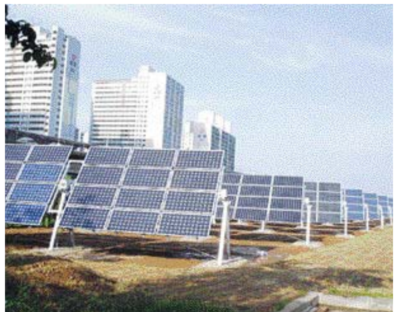
광양시 중앙하수처리장 인근에 준공된 태양광 발전시설. 전국 공공시설 가운데 두번째 큰 규모인 300kW급으로 156t의 온실가스 감축 효과가 기대된다.

광양시가 공공시설에 태양광 발전 시설을 설치하고 태양광 발전소 13개소를 유치하는 등 '솔라시티(Solar City)'로 발돋움하고 있다.