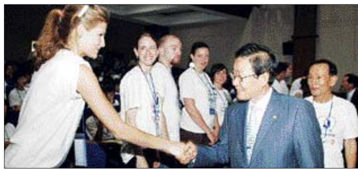
전남도교육청은 23일 담양, 곡성, 해남, 영암 등 도내 4곳에서 일제히 '영어여름캠프'를 열었다. 김장환 도교육감이 곡성 전남과학대학에서 캠프에 참가한 원어민 강사들을 격려하고 있다.

영어체험 프로그램과 다양한 상황을 설정한 테마부스를 통해 원어민 강사와 직접적인 대화 등을 통해 영어실력을 한 단계 높게 된다.