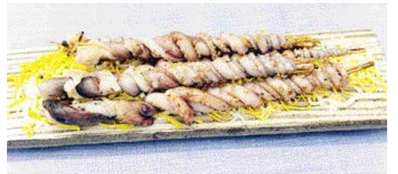
▲낙지호롱=①낙지에 간장, 설탕, 다진 파, 마늘, 후추, 참기름, 깨 등을 넣고 양념한다. ②대나무 찻가락에 ①을 돌돌 감아 석쇠에 구워낸다.

▶낙지 회무침 =낙지를 손질해서 끓는 물에 살짝 데친 다음 찬물에 헹구고 오이, 당근, 적채, 양배추, 배 등을 넣고 초고추장으로 버무려 낸다.