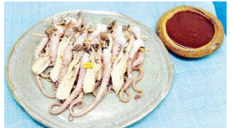
▶낙지 버섯 강화=①끓는 물에 낙지와 느타리 버섯을 데친다. ②꼬치에 번갈아 끼우고 초고추장을 곁들인다.