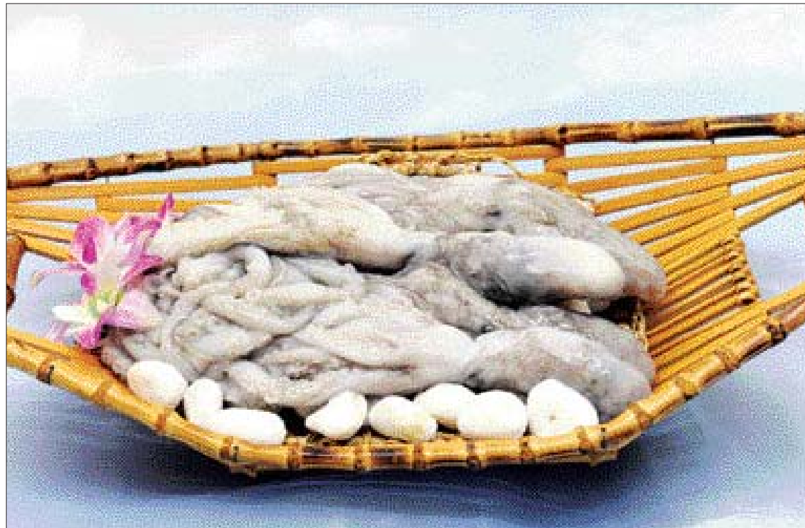
타우린과 인을 다량 함유하고 있는 낙지는 쇠한 기력을 회복하고 빈혈을 치료하는데 도움을 주는 식품이다.

'쟁기잡하다 쓰러진 소도 낙지 한 마리를 술에다 싸서 먹으면 벌떡 일어난다'는 말이 있을 정도로 낙지는 쇠한 기력을 회복시키는 최고의 보양식이다. 문어과의 해산물 중 타우린 성분을 가장 많이 함유하고 있다. 낙지의 전체 영양 성분 중 타우린