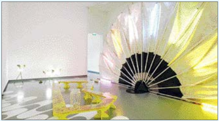
제니퍼 티 '사랑, 달콤한 낯잠(펼쳐진)(가리워진) 부채'

이들 작품은 지역 주민들과 학생들이 직접 골라 더욱 의미가 있다. 금과공고 학생 300명과 주민 200명이 그동안의 광주비엔날레 출품작을 보고 지난 14~22일까지 설문