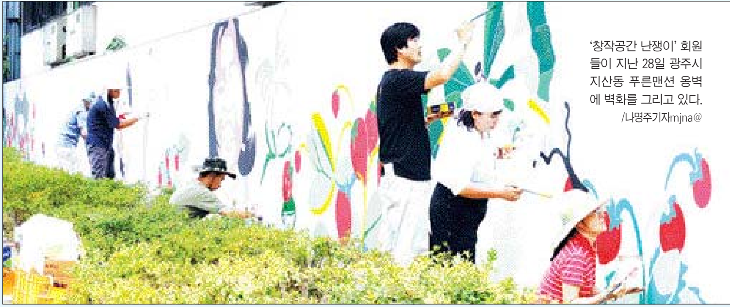
'창작공간 난쟁이' 회원들이 지난 28일 광주시 지산동 푸른맨션 옹벽에 벽화를 그리고 있다.