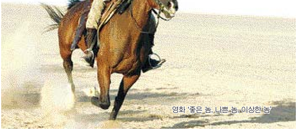
영화 '좋은 놈, 나쁜 놈, 이상한 놈'

가을 개봉 예정인 '고고 70'은 순도 100%의 음악영화다. /김미은기자 mekim@kwangju.co.kr