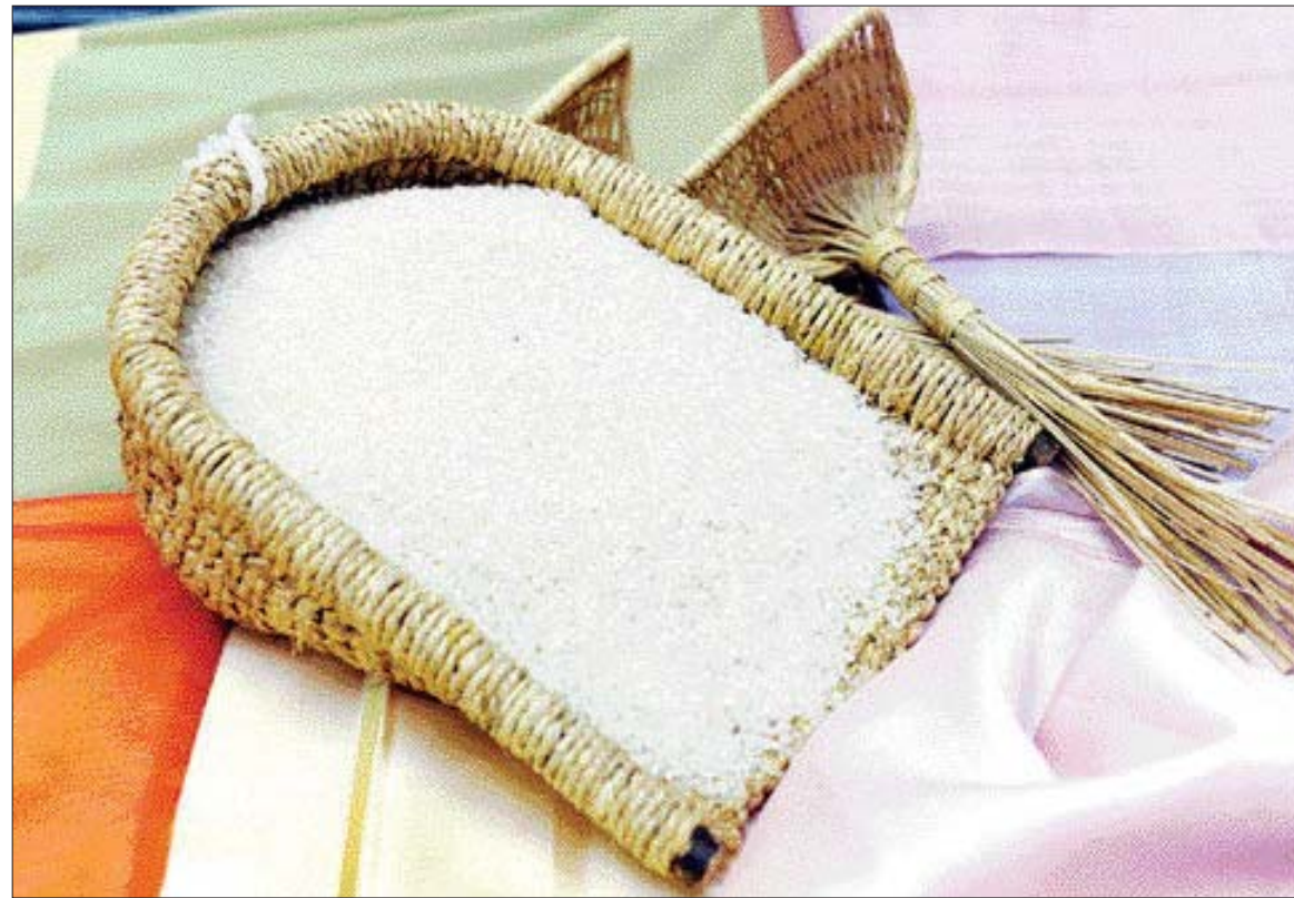
쌀에는 고혈압 치료를 돕고, 신경을 안정시키는 물질인 가바(gaba) 성분이 풍부하게 들어있다.

쌀눈에 풍부한 '가바' 신경 안정시켜 미백 효능 쌀뜨물 피부 미용에 좋아