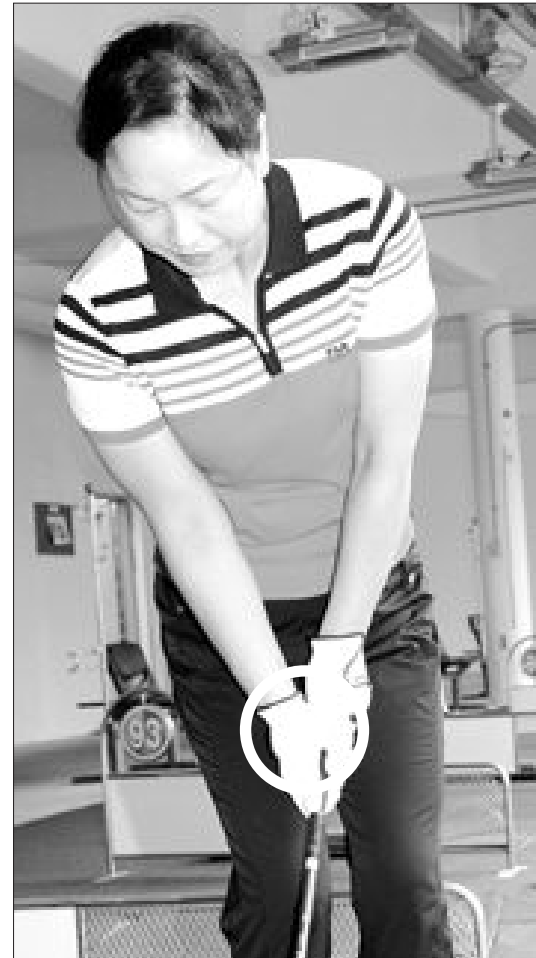
어프로치 어드레스에서 핸드퍼스트와 왼발에 체중이 실리지 않은 잘못된 동작(왼쪽)과 잘된 동작.