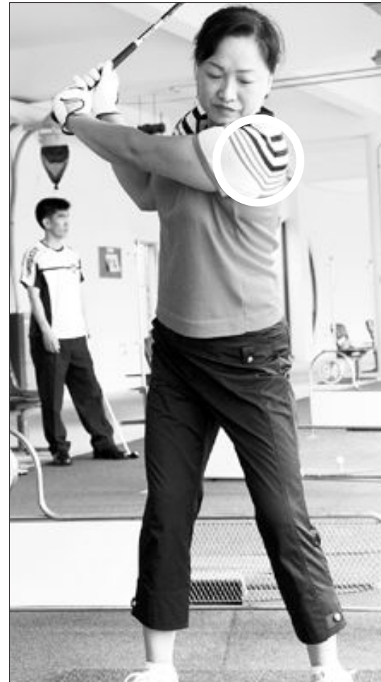
왼쪽 어깨 턴이 되지 않은 잘못된 동작(왼쪽)과 왼쪽 어깨 턴이 된 잘된 동작.