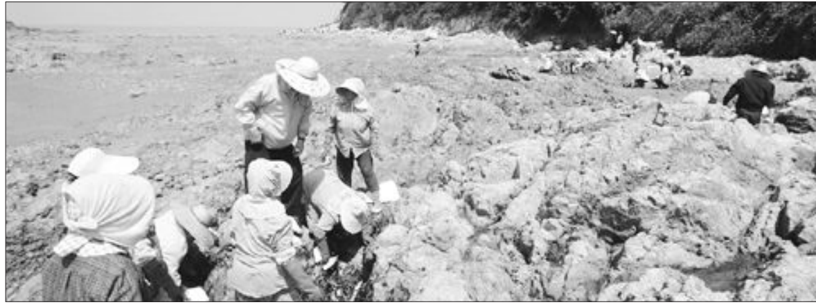
4일 오전 신안군 자은면 둔장리 바닷가에서 신안군청 공무원과 주민, 자원봉사자들이 자은면 해변으로 흘러들어온 기름 덩어리 제거 작업을 벌이고 있다.

더욱이 해안가 오일펜스가 사고발생 8시간 만인 지난 2일 오전 7시30분께 설치되면서 기름띠 제거가 이미 4개 섬지역을 덮치는 등 초기방제에 실패한 것이 피해를 키운 것으로 지적되고 있다.