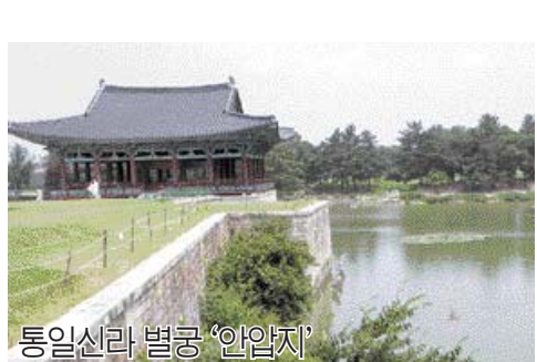
통일신라 별궁 '안압지'

흥선·백련이 머무는 길을 지나 다다른 대릉원은 20여기의 왕릉이 한데 모여 있는 곳으로 신라의 대표적 돌무지덧널무덤(5.6세기 적석목곽분)인 천마총과 최초의 김씨 성을 가진 왕인 미추왕릉이 있다. 토층두께 5m, 점토층 두께 0.2~0.3m의 천마총 내부는 돌무지덧널무덤과 청동제기, 금관, 새 날개모양 관장식, 귀걸이 등 전사제 있고 자작나무 껍질에 하늘을 나는 말 그림이 나와 무덤의 이름을 천마총이라고 한다. 발굴당시 1만 1천500여점의 유물이 나온 곳으로도 유명하다. 넓은 대릉원 안 푸른 논송 사이로 연꽃은 봉우리를 피운 배롱나무 꽃이 녹색의 캔버스 위로 붉은 점을 찍어 놓은 듯한 내부 전경도 무척 아름답다. 대릉원과 인접해 있는 첨성대는 직선과 곡선이 어우러진 조각의 건축물로 정경계 다가온다. 주황색 코스모스 군락지와 연꽃의 향연이 뒤로하고 찾은 곳은 통일신라 별궁이던 안압지다. 안압지는 통일신라 왕궁의 별궁에 자리한 연못으로 원래 이름은 월지(月池)로 삼국을 통일한 신라가 전성시대를 구가하기 시작한 문무왕 14년에 조성됐다.