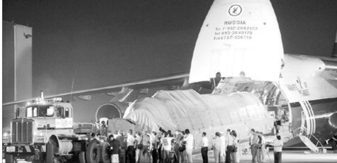
내년 봄 고흥 나로우주센터에서 쏘아올릴 한국 최초 소형위성발사체(KSLV-1)의 성능시험을 위해 들어온 1단 지상시험용 발사체가 러시아 화물기에 실려 지난 9일 오후 김해공항에 도착했다. 이 로켓은 11일 오후 나로우주센터로 옮겨진다.