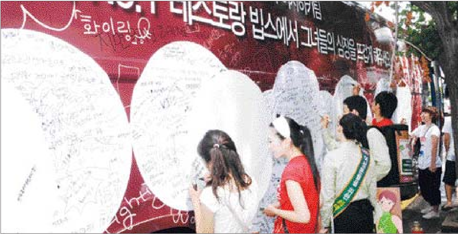
여자하키팀 금메달 기원

올해 상반기 전자어음의 발행 규모는 총 2만1천123건, 2조552억원으로 작년 하반기에 비해 건수로는 8.0%, 금액으로는 24.1% 늘었다고 한국은행이 12일 밝혔다. 전자어음의 발행 규모는 6천991건, 5천304억원으로 전기에 비해 각각 8.6%, 23.4% 증가했다. 전자어음은 실물어음과 달리 발행인과 수취인, 금액 등의 정보가 전자 문서 형태로 작성된 약속어음으로 2005년 1월 도입된 후 빠른 속도로 이용이 확산되고 있다. 6월 말 현재 전자어음 이용자 등 록한 기업은 총 1만9천203개로 이 가운데 발행인 등록기업은 321개, 수취인 등록기업은 1만8천882개로 각각 집계됐다. /연합뉴스