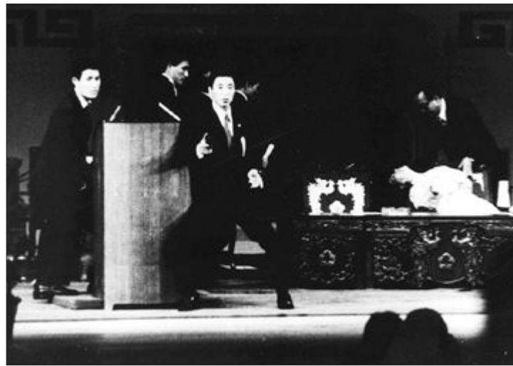
1974년 8월 15일 제29회 광복절 기념식에서 영부인 육영수 여사가 피격된 장면.

1974년 8월 15일, 제 27주년 광복절 경축 기념식이 열린 서울 국립극장에 총성이 울려 퍼졌다. 기념식이 중계되던 TV화면은 초점을 잃고 흔들렸고 곧 방송이 중단됐다. 그리고 이날 저녁 국민들은 영부인 육영수 여사의 서거 소식을 듣게 된다.