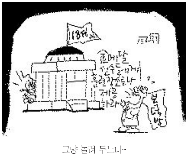
그냥 놀러 두느냐...