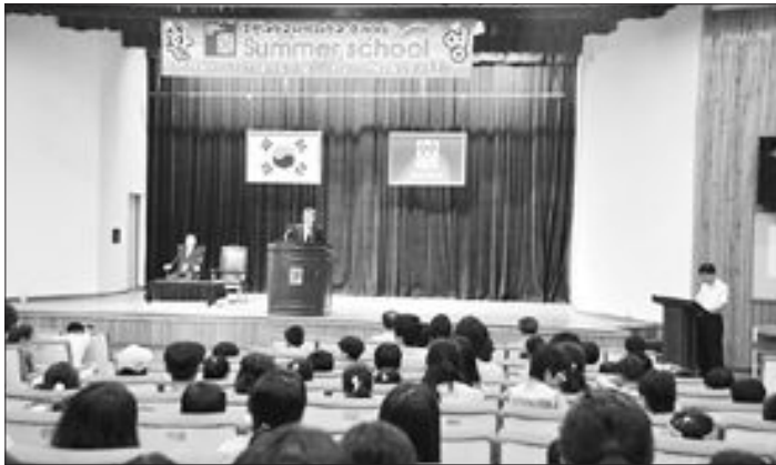
조선대 사범대 학생들이 진행하는 '2008 조선대 사범대와 함께 하는 섬머 스쿨'이 지난 14~17일 구례 청소년수련관에서 열렸다.