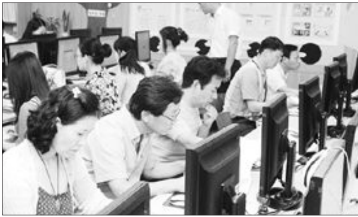
전남도교육청(교육감 김장환)은 최근 목포 부영초등학교 컴퓨터실 등 18개 평가장 26개 평가실에서 3천10명을 대상으로 제11회 교원 정보 활용능력 인증 평가를 실시했다.