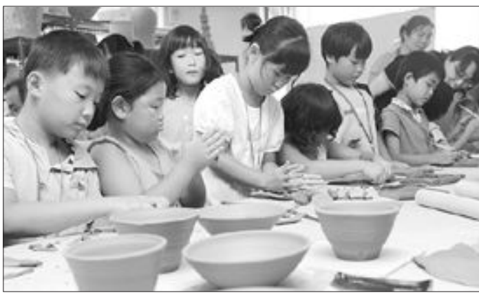
광주시 북구청(청장 송광운)은 여름방학을 맞은 초등학생 20여명을 대상으로 18일 오후 광주시 북구 건국동 광주전통공예 문화학교에서 도자기 체험 교실을 열었다.