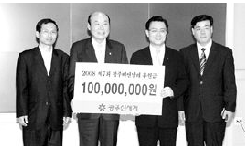
원을 기탁했다. 이번 광주비엔날레의 홍보 역할을 한 광주시세계백화점에는 '2008 광주비엔날레 홍보관'도 운영되고 있다.