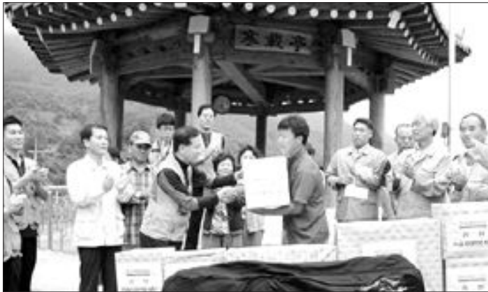
농협 전남지역본부 농업인 기술지원 무료봉사단 40여명은 최근 구례군 간전면 거석마을과 묘동마을을 찾아 독거노인들의 노후주거를 수리해주고 선풍기·밥솥 등 생활용품을 전달했다.