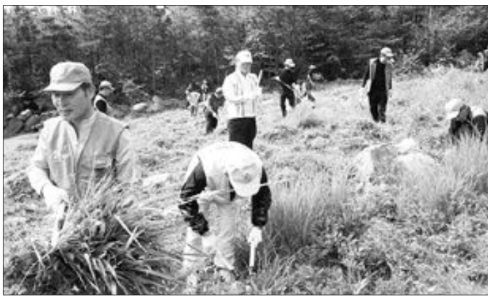
광양제철소 설비기술부와 광영동 금호회 회원들로 구성된 '광영사랑 나누미 연합 봉사단' 50여명은 추석을 앞두고 지난 23일 광영동 무연고 묘지를 찾아 벌초 봉사활동을 벌였다.