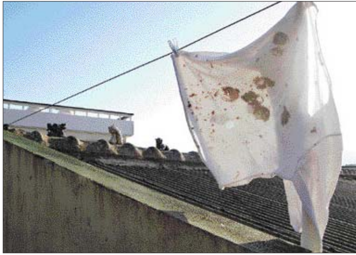
조은지 작 '진흙사-엑스터스'

마리아나 브니모브(베네수엘라)의 '초콜릿 셰크(chocolate shack)'는 관람객들이 초콜릿으로 지은 집의 향기를 맡고, 만져 본 뒤