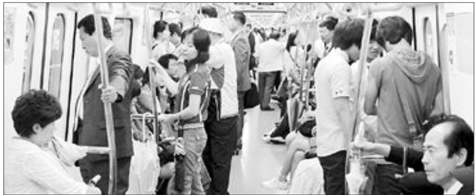
1996년 기공식을 시작으로 지난 4월 11일 완전개통된 광주지하철 1호선.

장을 통한 '신광주 메트로폴리탄' 구상을 밝히고 있다. 지난 6월 광주시는 제43차 용역과제 심의위원회 회의를 열고 '광주~화순~광주전남 공동혁신도시간 도시철도 건설 타당성 조사용역'을 원안 가결했다. 용역안에는 광주~나주 공동혁신도시 철도 연결방안, 광주 용산차량기지~화순 전남대병원간(1호선·10km) 지하철 노선 연장 등이 담겨있다. 광주시는 '신광주 메트로폴리탄' 구상으로 광주와 화순을 연결해 지역 상생발전을 꾀하고 광주~전남 공동혁신 도시의 대중 교통망을 확충하겠다는 방안이다. 백운 광장~조선대~광주역~터미널~시청~월드컵경기장 등으로 이어지는 지하철 2호선은 오는 2012년 착공될 예정이다. 환상(環狀)순환선으로 추진되는 2호선은 총 영업거리 22.1km로 9천400억원의 사업비가 투입될 예정이지만, 2호선을 운행할 열차의 기종 선정 문제와 일부 기관들이 지하철 노선 변경을 요구하면서 사업추진이 순탄치 않은 양상을 보이고 있다. /김여울기자 wool@kwangju.co.kr