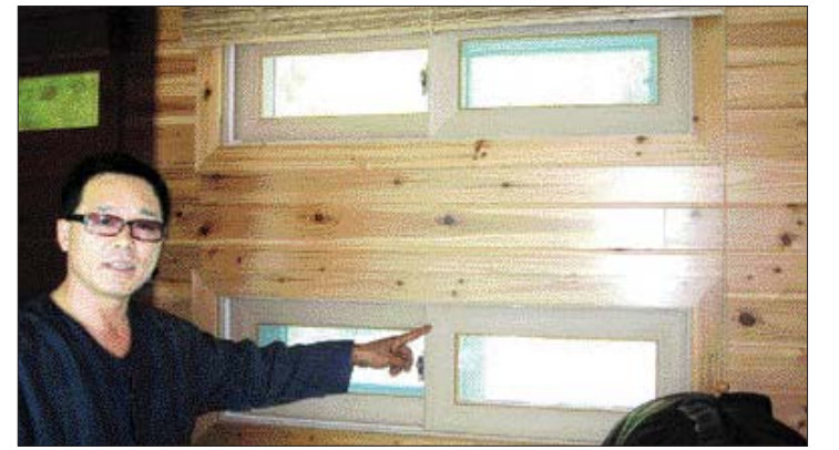
한옥건축에서 응용한 통풍시스템. 계절에 따라 바람의 방향이 다르다.

집안에는 이국적인 2m크기의 열대 야자수 15그루가 심어져 있다. 화단에 심어진 꽃들 사이로 긴꼬리제비나비와 박각시가 바삐 오간다. 집안