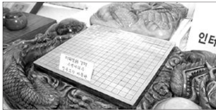
국내에서 처음으로 열린 바둑 경매에 출품된 1억2천만원짜리 현목 목상감 바둑판 ‘미죽’

두 낙찰됐다. 반면 시작가 1억2천만원으로 최고 금액에 나온 현목 목상감 바둑판 ‘미죽’, ‘난우’(7천만원), ‘기쁜만남’(7천500만원), ‘새천년’(9천만원), ‘새벽’(5천500만원) 등 고액 바둑판은 낙찰자가 없어 유찰됐다. 현목 목상감 바둑판은 목공예가인 김종환씨의 작품으로 현목에 목상감 기법의 전통 고유 디자인을 넣어 만들었다. 또 조훈현 9단의 스승으로 잘 알려진 일본의 겐사쿠 9단 친필 서예작인 ‘기(氣)(시작가 500만원), 한국 현대바둑 60주년 기념행사를 기념하여 후지사사와 슈코 9단