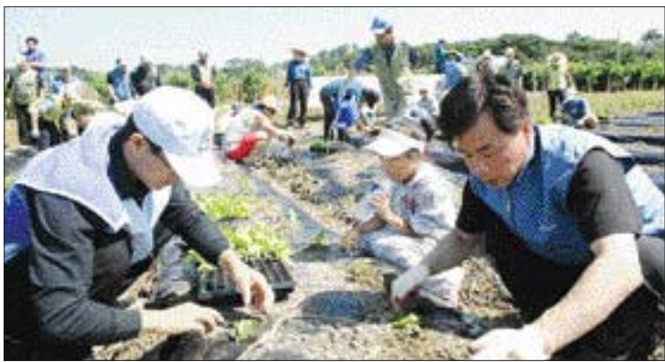
광양제철소 직원들은 지난달 30일 광양시 태인동 청년회와 함께 태인동 궁기마을 휴경지 2천640㎡에 김장배추 3만 포기를 심었다. 이들은 이 배추로 연말 김장을 담가 불우이웃에 전달할 예정이다.