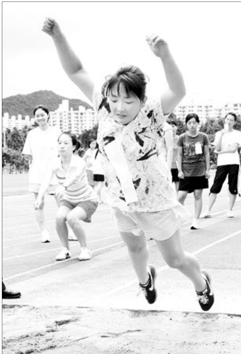
여경 응시자 체력시험

전남대병원을 비롯, 전북대병원, 강남성모병원, 서울성심자병원 등은 미국 쇠고기 급식사용 여부와 관련해 입장 표명을 유보했다. 보건의료노조는 향후 미 쇠고기 급식 불사용운동을 비롯해 조합원들의 친환경 먹거리 이용 확대, 시민사회와 연대한 공공급식운동을 펼칠 계획이다.