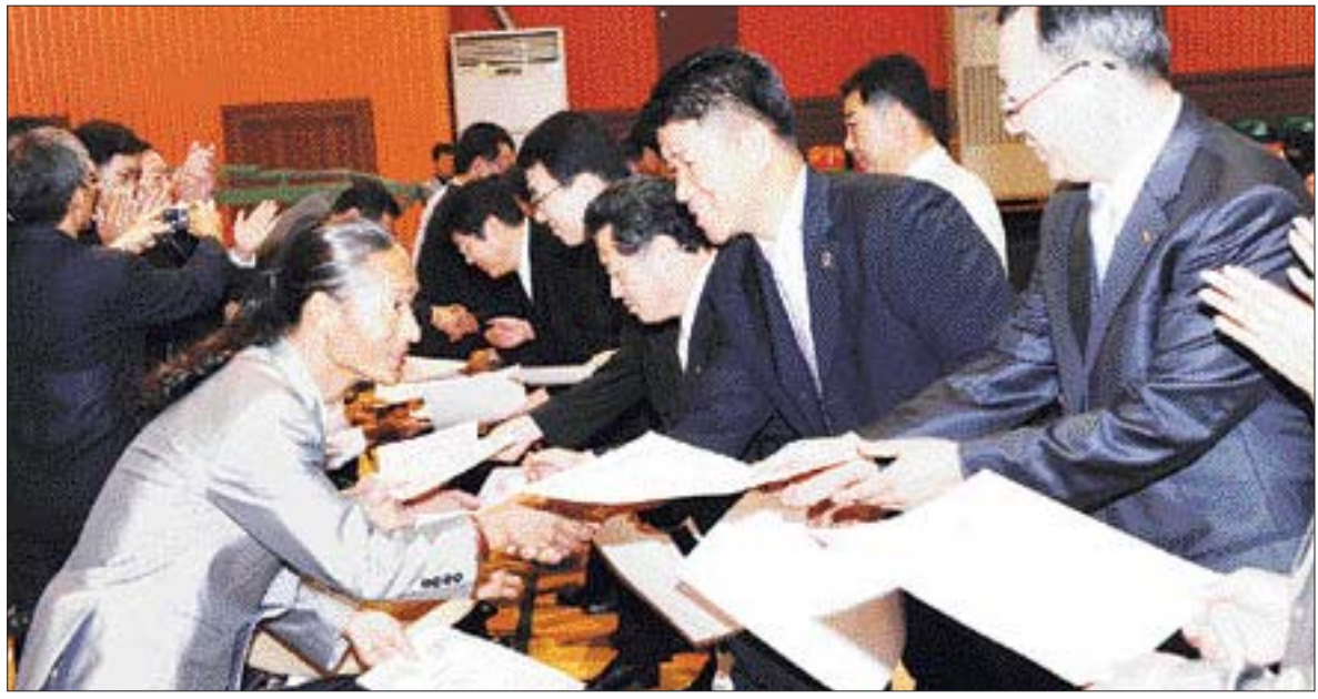
"장애인체육대회 성공 협력" 광주시장장애인체육회와 국제라이온스협회 355-B1 지구는 2일 광주시 북구 시립장애인복지관에서 18개 가맹단체 및 60개 단위를 클럽 자매결연식을 가졌다. 이들은 오는 10월 초 광주에서 열리는 전국장애인체육대회 성공 개최를 위해 협력키로 했다.

경 오염되면서 민원이 잇따르고 있기 때문이다. 피해 주민들은 "주민들이 심한 악취 등에 시달리고 있는데도 북구에서 제도시행을 이유로 쓰레기를 무작정 방지하는 것은 행정편의주의적 발상"이라며 "제도 시행도 좋지만 애초에 주민들에게 피해를 끼쳐선 안 되는 것 아니냐"고 대책마련을 요구했다.