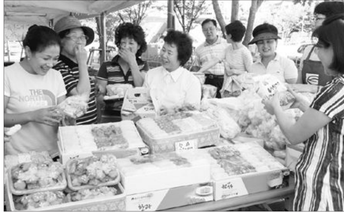
“추석 준비 직거래 장터로 오세요” 광주시는 추석을 맞아 3일부터 5일까지 '광주지역 우수 농특산물 직거래장터'를 상무지구 BYC건물 앞 인도변에 개설했다. 이 장터에는 떡과 김치, 한과류를 비롯 광주에서 생산되는 다양한 농수특산물을 시중가 보다 20~30% 싸게 판매하며 '한우고기 소비촉진 시식회'도 함께 열린다.

간을 추석 특별 교통대책 기간으로 정하고 철도와 고속버스, 시외버스, 항공이 운항 횟수를 늘릴 계획이다. 이 기간 철도는 객차 수가 하루 평균 458량 늘어난 5천551량이 운행되고 고속버스는 예비차 114대가 투입돼 하루 평균 운항 횟수가 638회 늘어난다. 시외버스는 상용차 7천927대, 예비차 260대가 투입되고, 국내선 항공기는 평상시보다 14% 늘어난 하루 평균 317회가 운항된다. 국토부는 올 특별교통대책 기간에 전국에서 지역간 3천440만 명, 하루 평균 688만 명이 이동할 것으로 전망했다. 이는 지난해 같은 기간에 비해 2.3%, 평상시 보다 105.5% 증가한 인원이다.