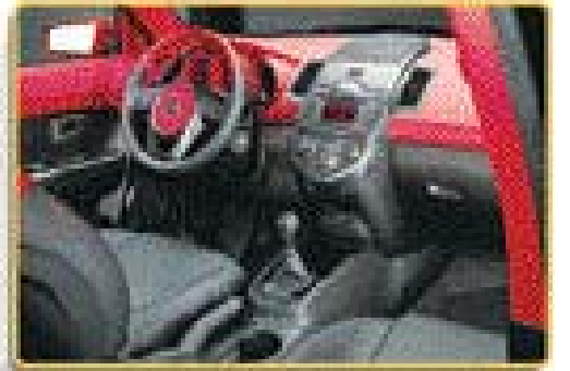
▲ 빛을 이용한 실내 인테리어