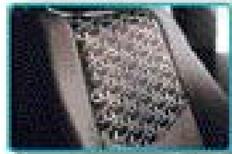
▶ 시트 상단에 'SOUL'의 야광 문자를 넣어 라이팅 시트