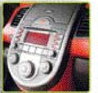
▶ 오디오 장치

다. 파워와 경제성을 겸비한 셈이다. 호랑이의 코와 입을 묘사한 차의 패밀리 리룩이 적용된 라디에이터 그릴, 와이드한 앞 범퍼와 불륨감 넘치는 앞바퀴 휠 하우징은 외관 만으로도 속도감이 느껴진다.