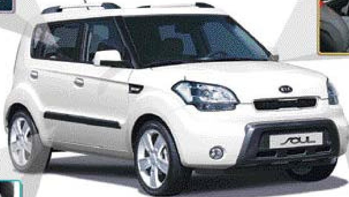
기아차 신개념 크로스오버 차량 '쏘울'