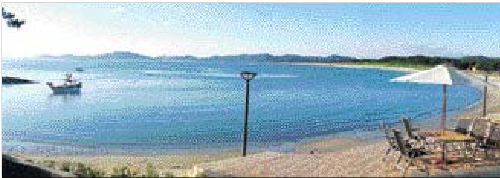
신안군 '증도'는 최근 아시아 최초로 슬로시티(Slow city)로 선정돼 국제적으로도 천연의 아름다움을 인정받게 됐다. 우전해수욕장의 전경.