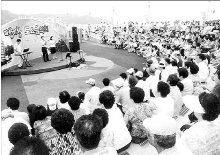
강진 마량항에서 토요일음악회에 참석한 관람객들이 즐거운 시간을 보내고 있다.

퀴즈나 대금 연주 등 각종 재미거리로 경매의 딱딱한 분위기를 부드럽게 해 호평을 받고 있다. 군은 이와 함께 마량 가구기 사업의 하나로 설치한 마량항 바다 위 야외무대에서 매주 토요일 열고 있는 음악회도 청자경매와 연계해 문화 상품으로 적극 육성 중이다. 2006년 11월 첫 공연을 시작한 이 음악회는 바다 위 무대에서 가요, 국악, 댄스, 연주회 등 모두 50여 차례 공연을 가졌다. 천연기념물 상록수림과 연륙교 등이 자리 잡은 마량항은 지난 2006년 바다 위 무대와 방파제 정비, 야간경관 설치 등 어항과 관광의 기능이 복합된 미항 사업을 추진하면서 강진을 대표하는 관광지로 급부상 중이다. 군 관계자는 “토요일만 되면 청자 경매에 참가한 뒤 마량항에서 신선한 회를 맛보고,